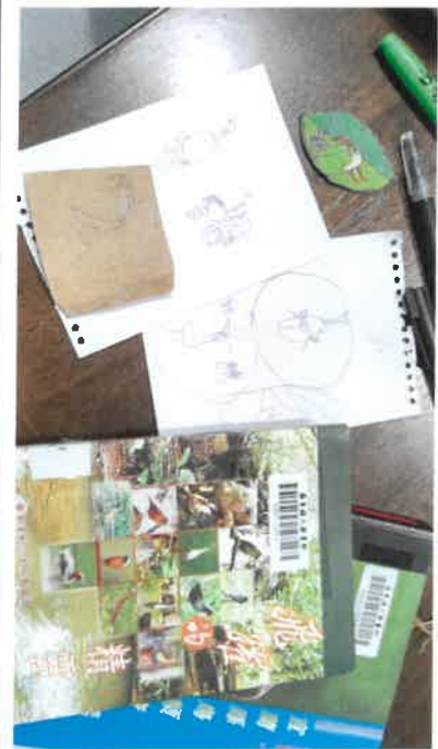
指北針做成一片葉子代表水田