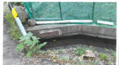
觀察水路時發現的石牌