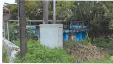
四結和五結圳幹線