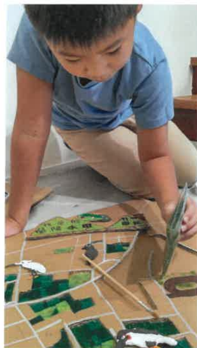
使用草粉製作草地