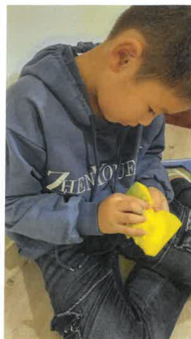
準備水田用道具-菜瓜布