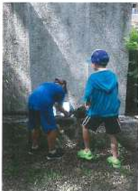
小組討論前的開關熱身