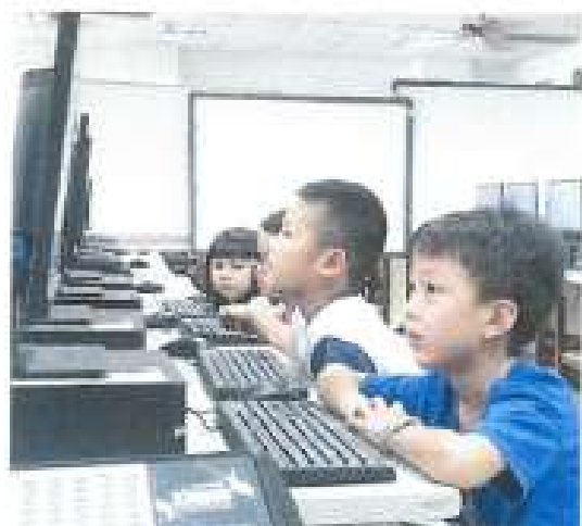
學習資料統整數位化