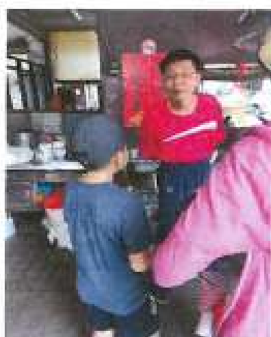
訪問北港圓環滷肉飯