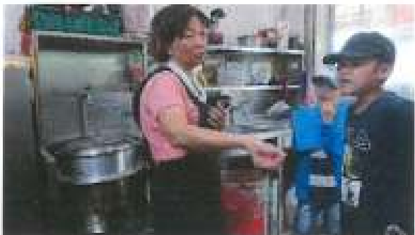
訪問秋月生炒鱸魚

圖例，代表內用有提供非一次性餐具的店家。希望大家看到這張地圖時，對我們的巧思能會心一笑。