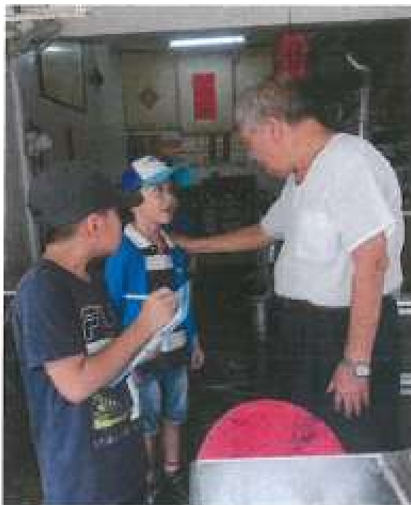
訪問光明路自助餐