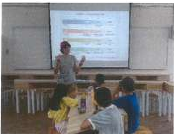
安排上課充實環保新知