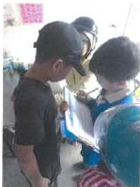
學習速記採訪重點