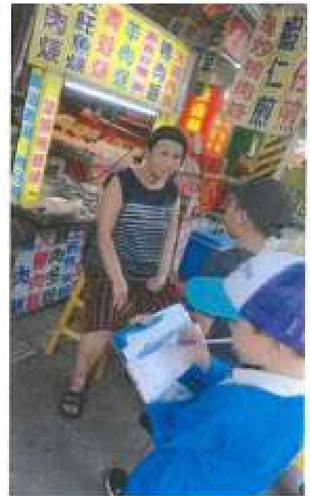
訪問中山路熱炒店