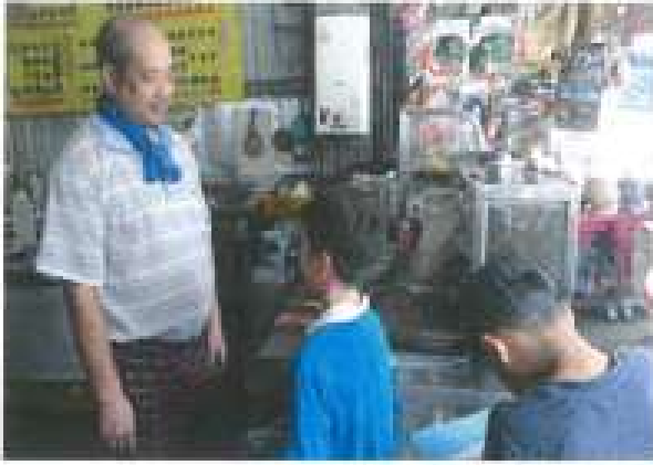
訪問中山路羊肉店