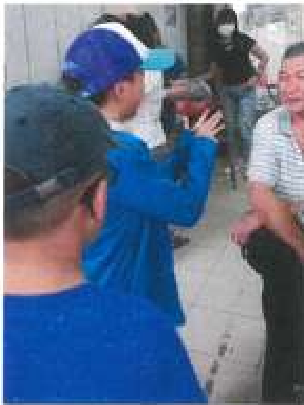
訪問中山路鵝肉陳